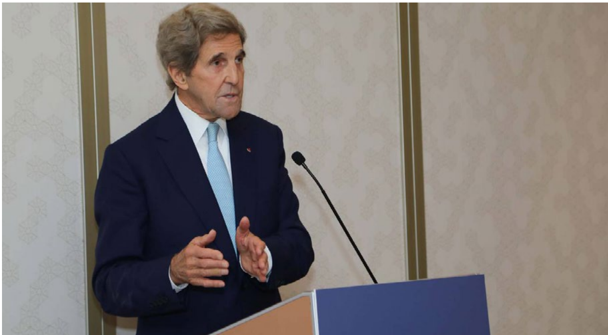
John Kerry, US Special Presidential Envoy for Climate.

During the past 12 months, One Planet sovereign wealth funds, asset managers and private investment companies have engaged in peer exchanges on technical competency including carbon foot-printing and the implementation of the TCFD recommendations. In June, Growthfund, the national fund of Greece, hosted two days of expert meetings in Athens for Network members.