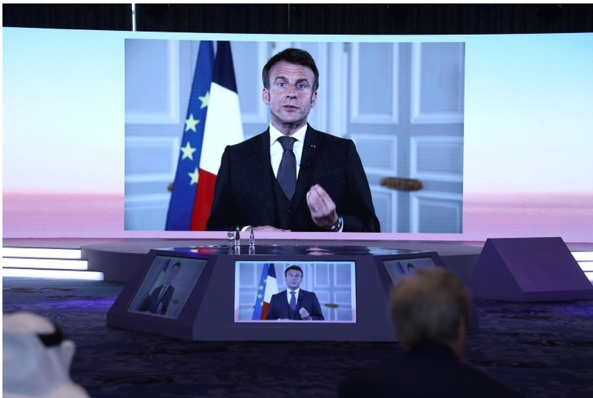
Ο Εμμανουέλ Μακρόν